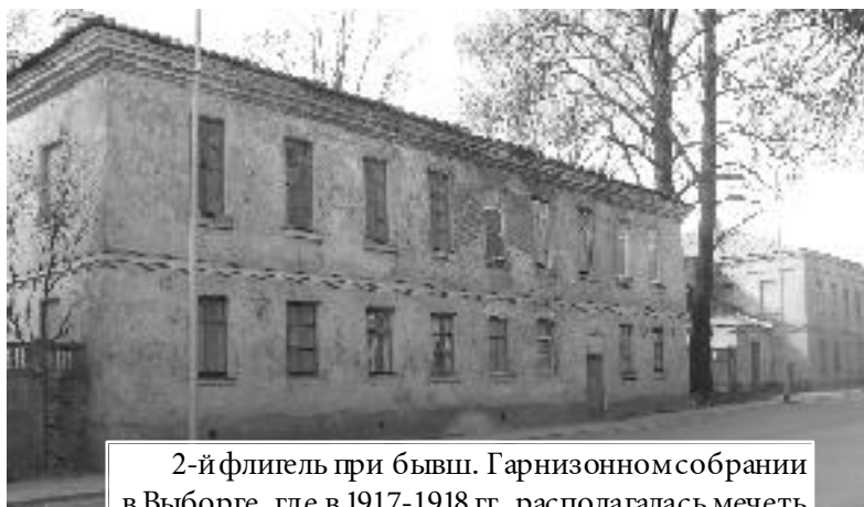
2-й флигель при бывш. Гарнизонном собрании в Выборге, где в 1917-1918 гг. располагалась мечеть

В конце декабря 1917 г. в Гельсингфорсе начал формироваться 1-й Финляндский стрелковый мусульманский полк. Основу полка составили военнослужащие-мусульмане 128-й и 129-й пехотных дивизий.